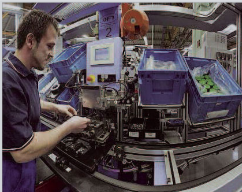
Eine Dichtung für eine Lkw-Bremse montiert dieser Mitarbeiter des Knorr-Bremsewerkes Aldersbach.

Doch all diese Maßnahmen hätten nicht ausgereicht. Nachdem bereits 2008 knapp 60 Stellen gestrichen worden seien, hätten 2009 rund 300 abgebaut werden müssen. Neben Zeitarbeitern hat es auch rund 200 Stamm-Mitarbeiter getroffen. Aktuell seien im Knorr-Bremsewerk Aldersbach noch 736 Menschen beschäftigt. Der Abbau ist laut Henghuber in „enger Kooperation mit den Mitarbeitervertretungen“ erfolgt. Und er sei „bei weitem unter dem Wert